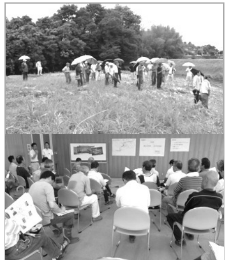
ときがわ町主催の説明会の様子(7月1日)